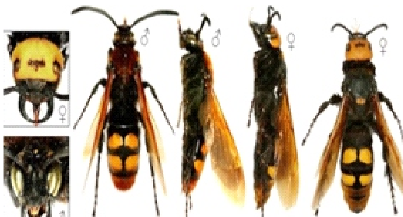
Óriás törösdarázs ( Megascolia maculata )